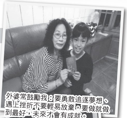
外婆常鼓勵我：要勇敢追逐夢想、遇上挫折不要輕易放棄、要做就做到最好，未來才有成就。

外公退休後，外婆就常陪著外公去 KTV 高歌一曲或是跟團旅遊，打發閒暇時間。她有空也會到公廟裡當義工，或跟好姊妹們聚會聊天，維持自己的社交活動。外婆說目前最希望舅舅早日成為爸爸，而在這之前就先享受一下自由時間吧！