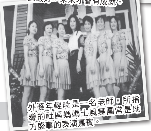
外婆年輕時是一名老師，所指導的社區媽媽土風舞團常是地方盛事的表演嘉賓。