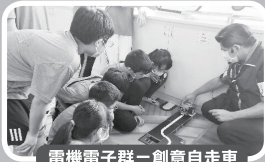
電機電子群－創意自走車

體驗餐飲業內外場人員的工作內容，學習如何備料、烹調、擺盤，製作一份健康衛生又美味的早餐拼盤！