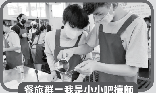
餐旅群－我是小小吧檯師

認識程式設計的基本概念，並學習編寫程式讓機器車能夠完成指令，體驗軟體設計工程師與系統管理師的工作內容。