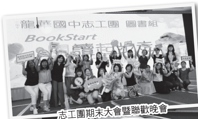
志工團期末大會暨聯歡晚會

雖然是微小的我，卻能夠在這個志工團隊當中，看到大家的團隊付出和努力，累積成一股強大的力量，讓龍華國中的孩子和校園都能更好。