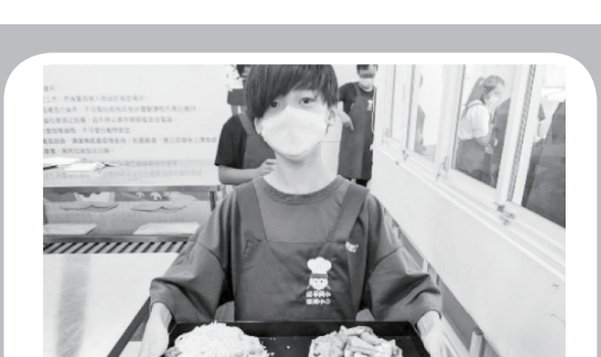
餐旅群－魔法烘焙師

透過本課程帶你認識各式空拍機，透過平板或手機進行飛行操控體驗，並學習如何編寫程式語言對無人機下達指令與視覺探查。