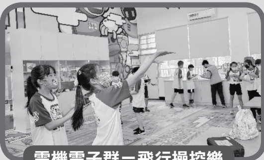
電機電子群－飛行操控樂

體驗吧檯師的工作內容，認識飲調需使用的工具，如吧叉匙、量酒器、奶泡壺等，並學習如何調製美味又美觀的飲品，以及了解如何清潔器具。