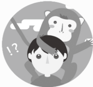
跳到身上該怎麼辦?