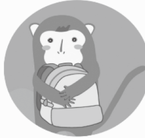
拉扯背包該怎麼辦?