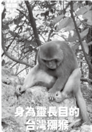
身為靈長目的 台灣獼猴